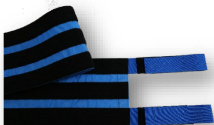
高品質なクラレ社製マジックテープ®使用

折り畳み式ハンドルの台車の使用はおすすめできません。 ※台車マキの損傷につながります。